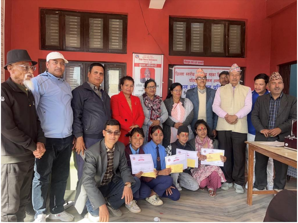
शिक्षा विकास निर्देशनालयको आयोजनामा जुम्ला जिल्लामा सन्चालन गरीएको एकीकृत शैक्षिक व्यवस्थापन सम्बन्धी तालिम