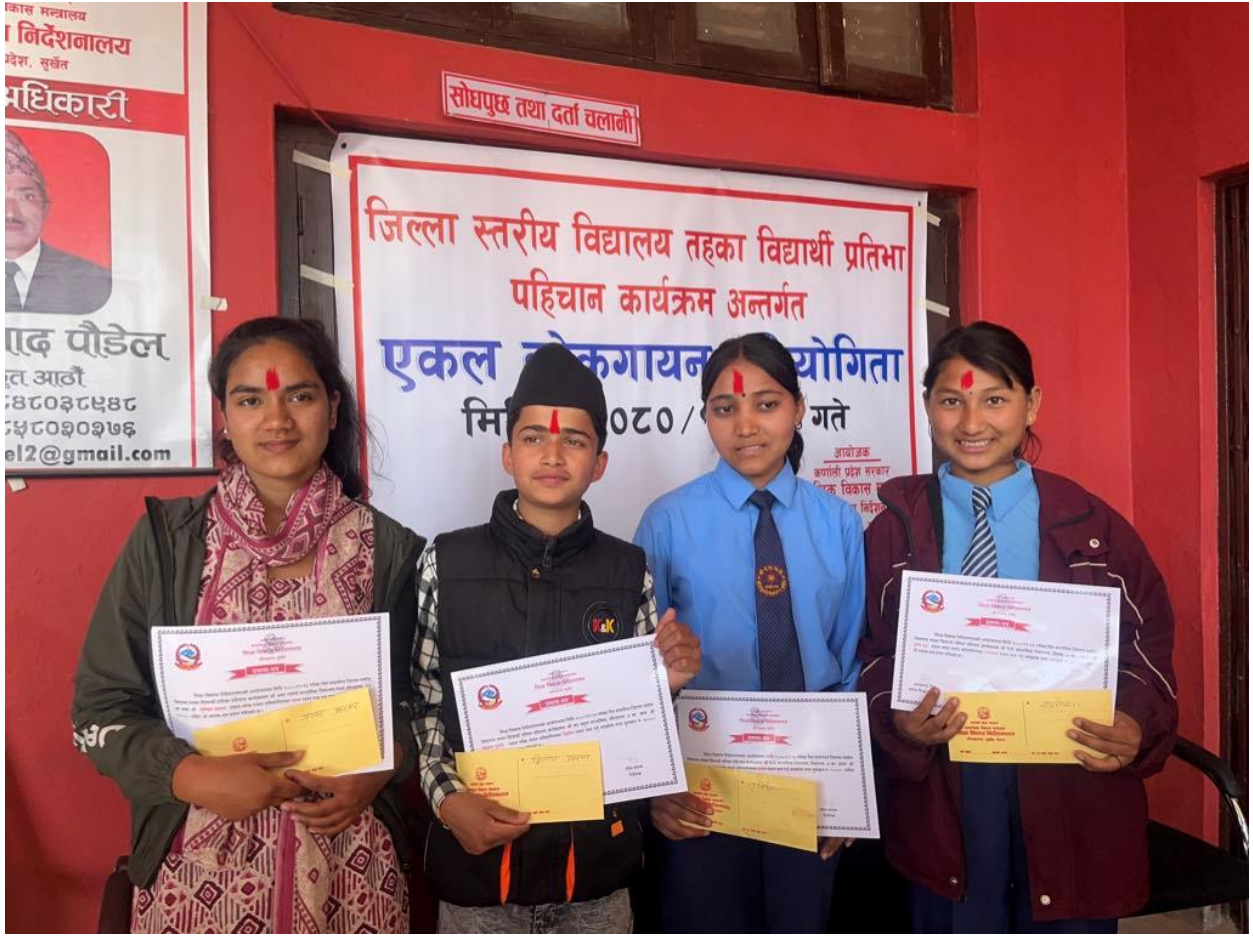
जिल्लास्तरीय प्रतिभा पहिचान कार्यक्रममा निर्णायक मण्डल सहित पुरस्कृत विद्यार्थीहरु