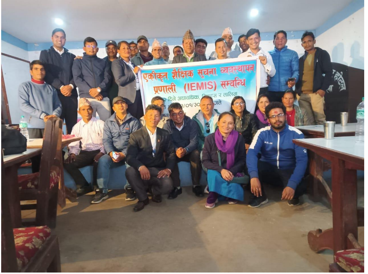
SEE २०८० को उत्तरपुस्तिका परीक्षण तथा सम्परीक्षण गर्दै शिक्षकहरु